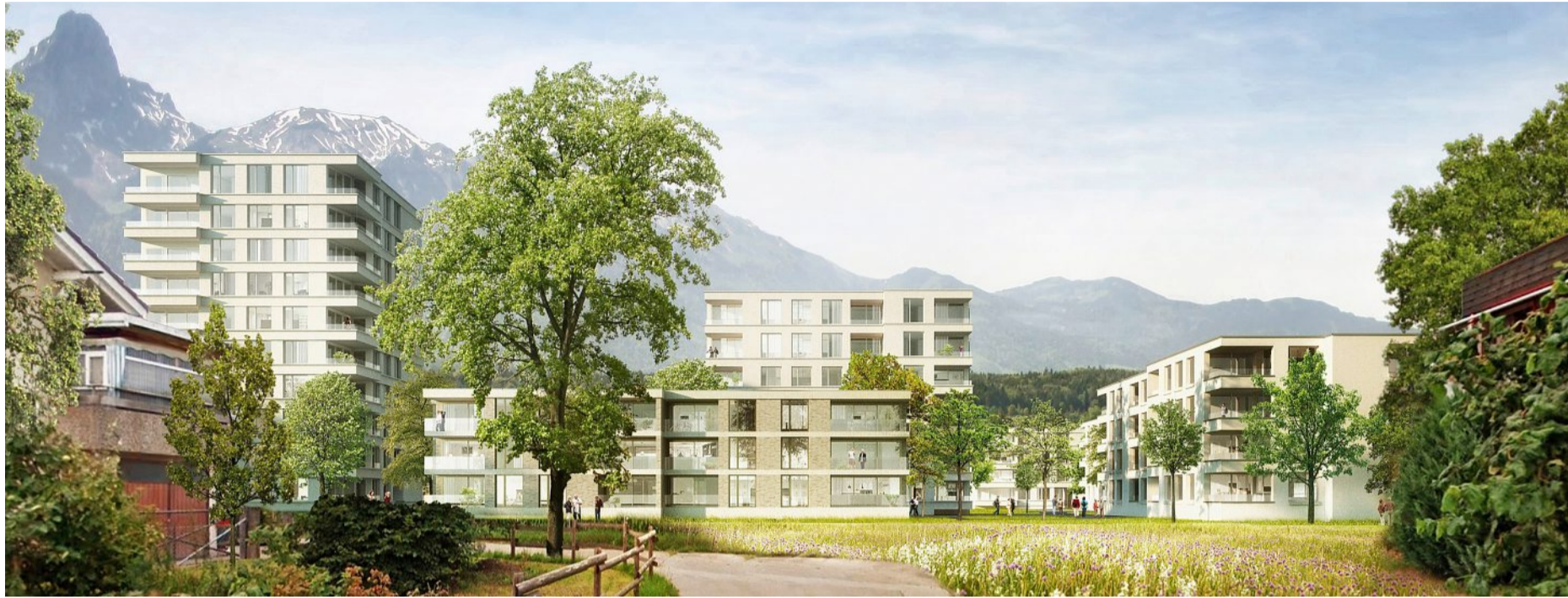
So oder ähnlich soll die geplante Überbauung Hoffmatte dereinst aussehen. Über die entsprechende Zonenplanänderung befindet nun das Stimmvolk.

Thun Neuer Widerstand gegen das Bauprojekt auf der Hoffmatte: Der Gwatt-Schoren-Buchholz-Leist hat für das Referendum gegen die vom Stadtrat bewilligte Zonenplanänderung über 1000 Unterschriften gesammelt.