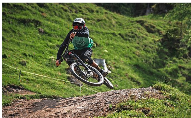
Bis Biker auch auf dem Heartbeat Trail am Niederhorn ins Tal sausen können, wird noch etwas Zeit vergehen.